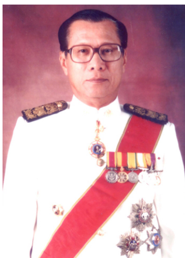
นายเกษม สุวรรณกุล

ดำรงตำแหน่งนายกสภาฯ 29 มกราคม 2544 - 28 มิถุนายน 2545