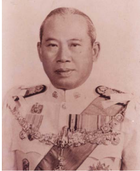
จอมพลถนอม กิตติขจร

ดำรงตำแหน่งนายกณะกรรมาการ พ.ศ. 2507 – พ.ศ. 2512