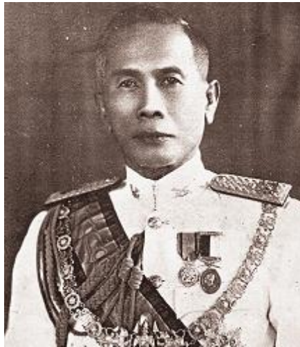
จอมพล ป. พิบูลสงคราม

รายนามผู้ดำรงตำแหน่งนายกคณะกรรมการมหาวิทยาลัยศิลปากร