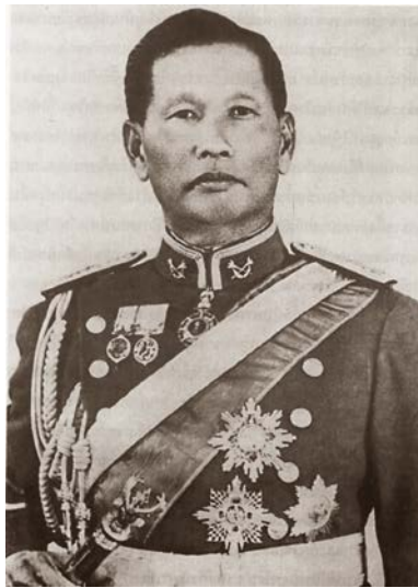
จอมพล สฤษดิ์ ธนะรัชต์

ดำรงตำแหน่งนายกณะกรรมาการ พ.ศ. 2501 – พ.ศ. 2503