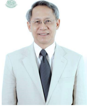
นายกราเดช พยัฆวิเชียร

ดำรงตำแหน่งนายกสภาฯ 13 มกราคม 2558 – ปัจจุบัน